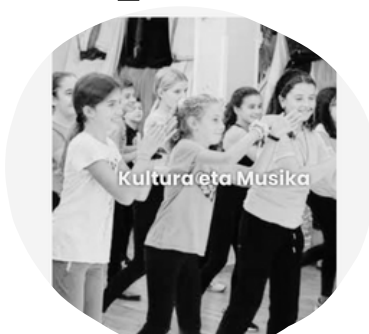
Culturales y musicales